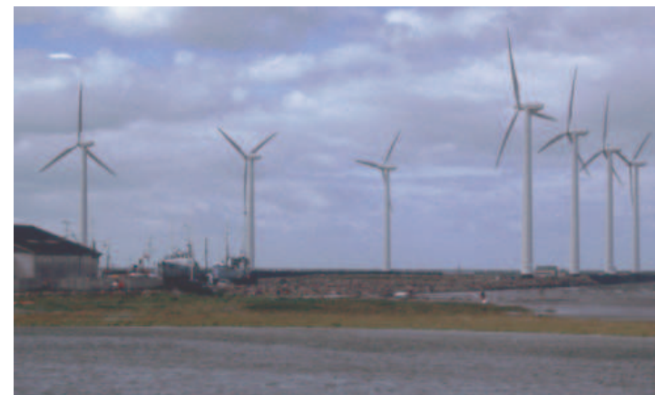
Vindmøller ved Bønnerup havn Sommeren 2002